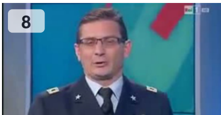
Rai1, l'incredibile tenente colonnello: auto-elogio in diretta (anche senza il touch screen) - Libero Quotidiano

Expertum è una società Hr è specializzata nel reclutamento di figure tecniche e commerciali nel mercato tedesco. Expertum si rivolge alle aziende nel settore delle costruzioni, ingegneria e progettazione, industria aeronautica e chimica-farmaceutica. La consociata 'Expertum Blue' è specializzata nella somministrazione di personale nella produzione, nell'automotive e nella logistica. Con oltre 40 uffici e 30 anni di esperienza, accompagna le aziende offrendo servizi di alta qualità.