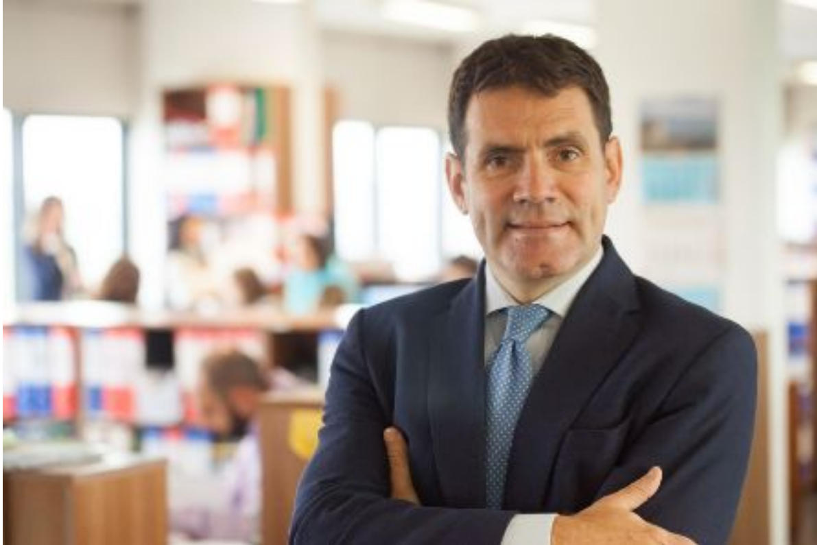
Roma. Gli ospedali pubblici

inglesi cercano centinaia di infermieri italiani. Si offrono solo contratti a tempo indeterminato. Occhio, però, alla conoscenza della lingua inglese.