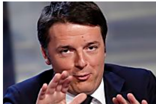
L'Italia secondo Renzi: tasse giù e ripresa