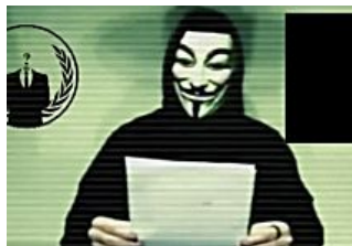
L'allarme di Anonymous: sventato un attacco dell...