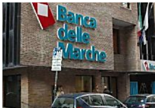
A casa Renzi tre mutui da ottocentomila euro