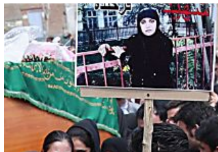
Il video choc del la ragazza lapidata a Kabul:...