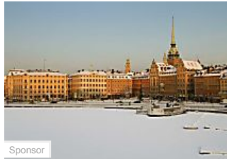
I 20 viaggi più economici per l'inverno (Skyscanner)