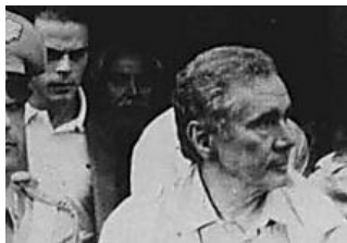
Dopo trent'anni il caso Tortora divide i due ex pm