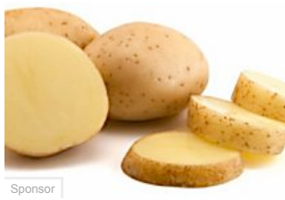
I 5 cibi più velenosi che tutti mangiano (topfive.it)