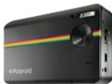
234,90 € Vedi Galaxia