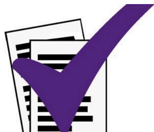
Editoria, un bollino viola per distinguere notizie e bufale -->