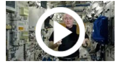
Ping pong nello spazio

Per scrivere un commento è necessario registrarsi ed accedere: ACCEDI oppure REGISTRATI